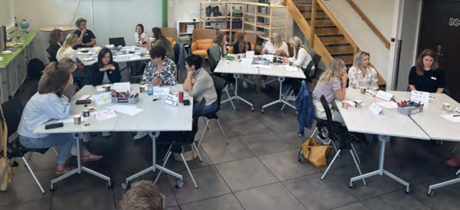
Workshop i Innolaben.

Ein viktig del av kompetansearbeidet i 2025 var konferansen Digital drivkraft , som vart arrangert 15. oktober. Konferansen samla deltakarar frå kommunane, samarbeidspartnarar og regionale aktørar, og hadde særleg fokus på digital transformasjon, endringsleiing og berekraftig utvikling av kommunale tenester. Konferansen bidrog til felles forståing, inspirasjon og styrka nettverk på tvers av kommunane, og vart opplevd som eit relevant og nyttig kompetansetiltak for regionen.