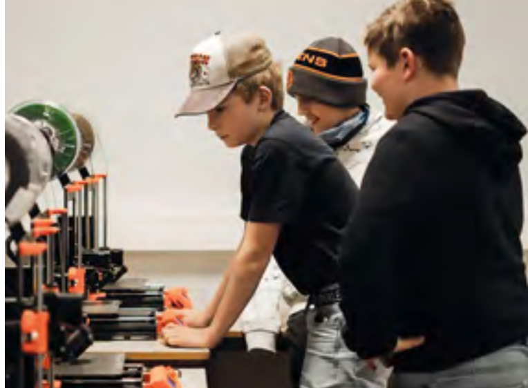
Mykje å lære hos Industri- og Teknologifaglinja ved Nord-Gudbrandsdal VGS.

førebygging av fysiske og psykiske helseutfordringar, og dessutan utjamning av sosiale helseforskjellar. Samtidig gir prosjektet lokale lag og foreiningar ein arena for synleggjering og rekruttering.