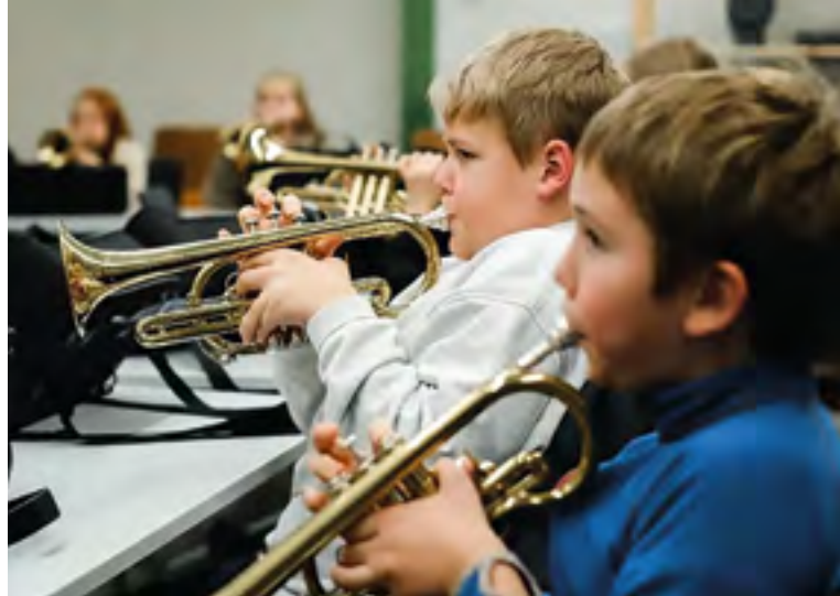
Øving gjer meister med Otta Skolekorps

sju moglege tiltak. Etter forankring i alle dei seks kommunane i regionen, vedtok IPR å prioritera eitt til to pilotprosjekt for vidare utprøving i perioden 2025–2026.