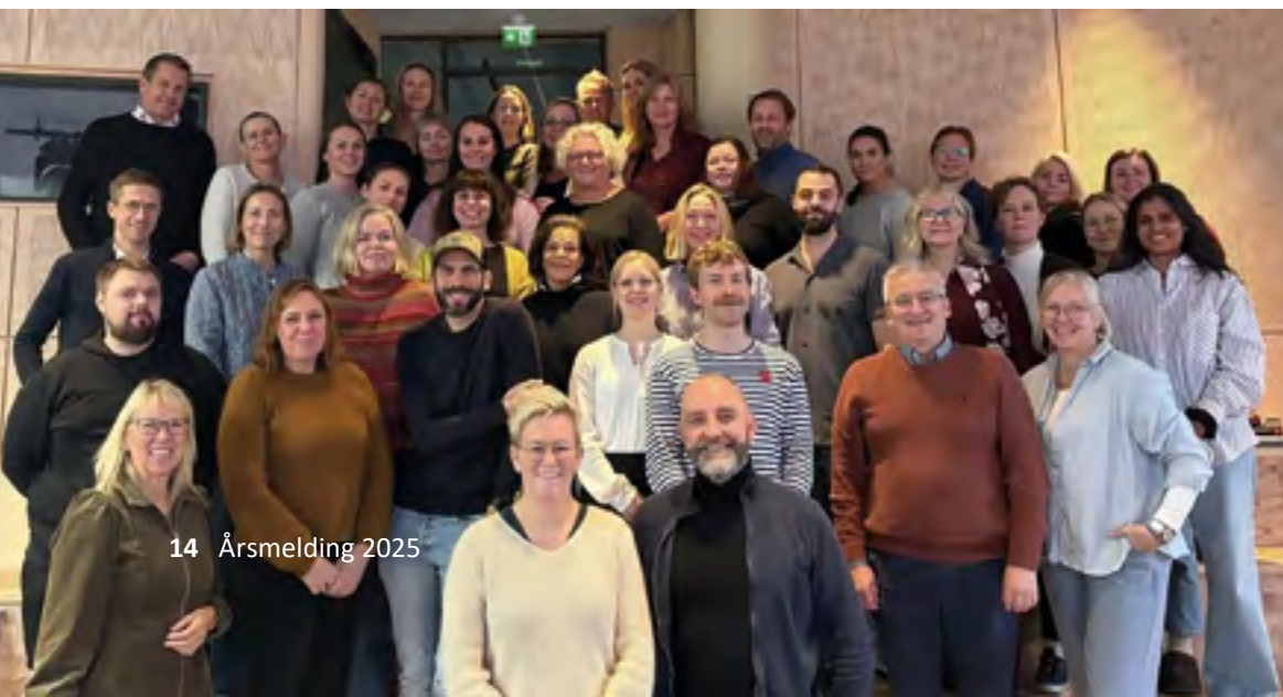
Erfaringsseminar med Helsedirektoratet.

Samtidig viser erfaringane frå 2025 at vidare skalering av digital heimeoppfølging krev tilstrekkeleg kapasitet til handtering av varslar, alarmar og hendingar frå teknologien. Når oppfølginga blir organisert lokalt i kvar kommune, kan tenesta bli ei tilleggsteneste som legg press på allereie avgrensa personalressursar. På bakgrunn av dette