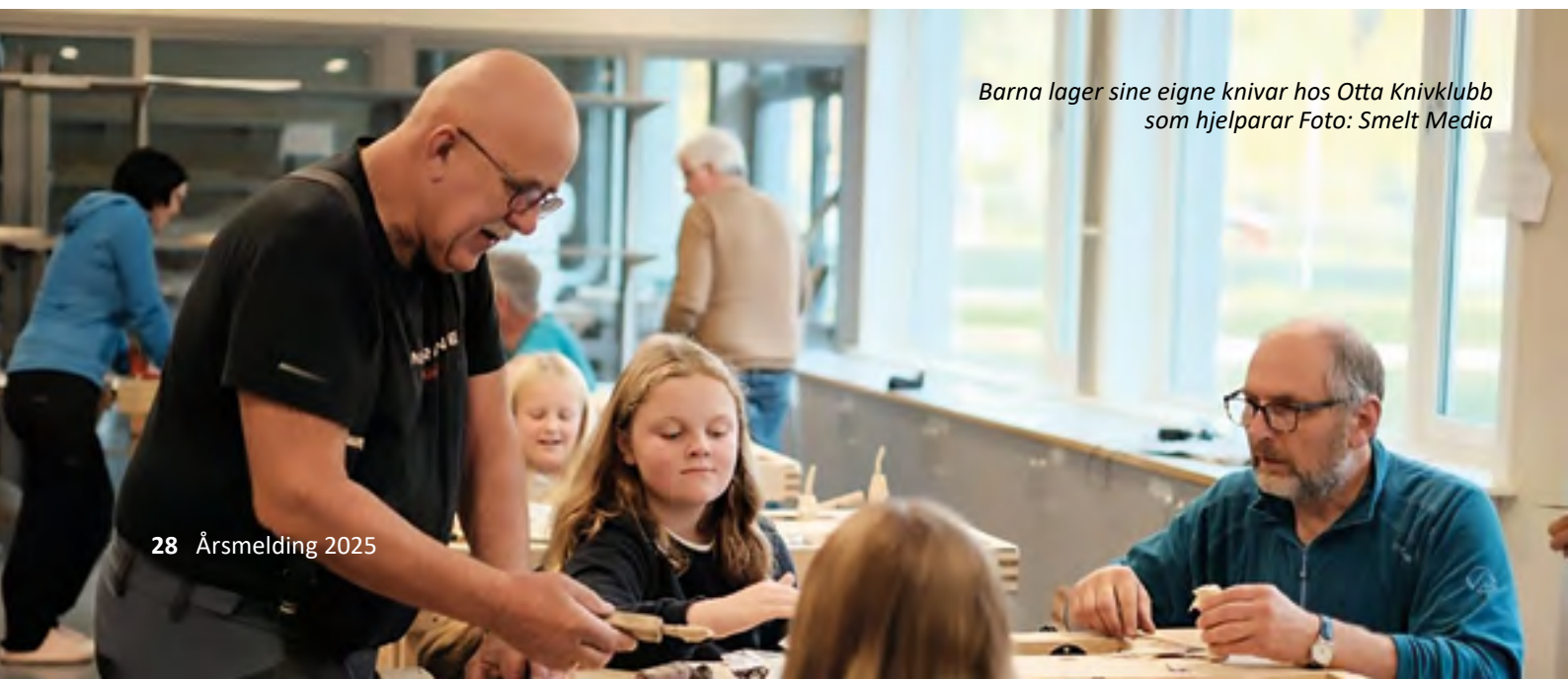
Barna lager sine egne knivar hos Otta Knivklubb som hjelperar

sjektet har hatt eigarskap i IPR, i tett samarbeid med det frivillige og regionale støtteaktørar. Kartlegging blant 28 frivillige organisasjonar i Sel og Vågå kommunar, og dessutan workshop og brei involvering. Dette resulterte i identifisering av