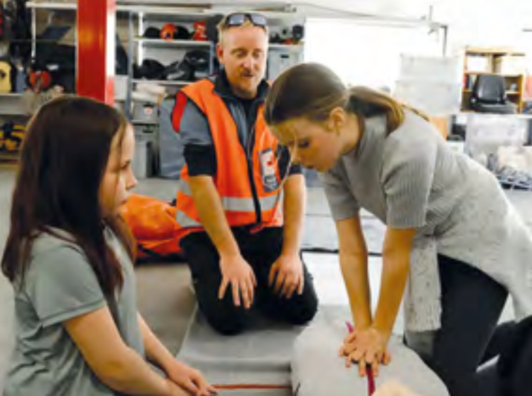
Otta Røde Kors Hjelpekorps instruerer barna